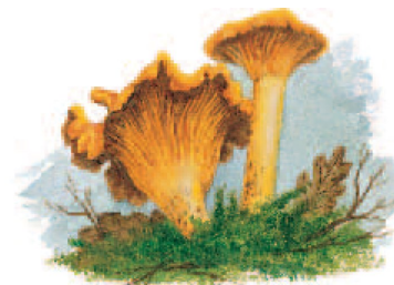
Illustration : Hervé LE GRAËT