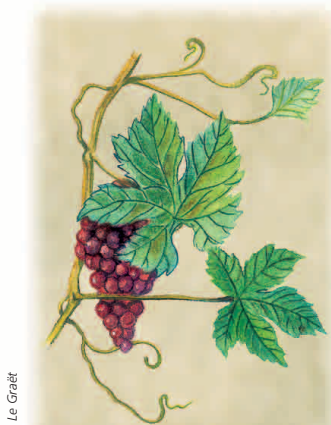
Vigne Vitis vinifera vitacées