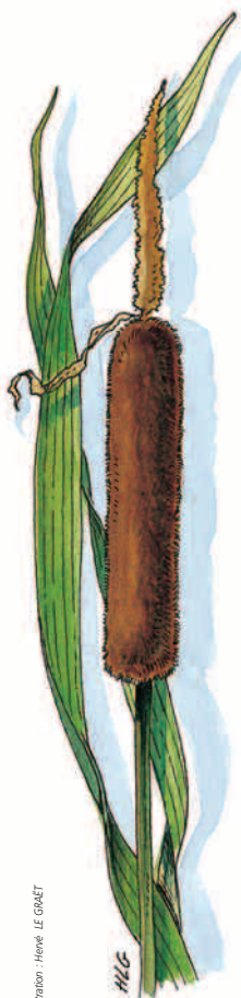
Illustration : Hervé LE COÛET