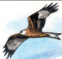
Illustration: Hervé LE GRÂT