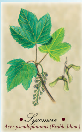
Illustration : Hervé LE GRAËT

meène par un zigzag vers la Croix de Montról érigée à la mémoire de André Marie François de Montról, mort ici en 1880 à la suite d'une chute de cheval, alors qu'il se promenait dans les bois du château. Si vous continuez à droite après la croix et le long d'un fossé, vous retrouvez alors le chemin de la Belle Faysse. Sinon reprendre la promenade où vous l'avez quittée. Passer devant un pylône de communications hertziennes et poursuivre tout droit en descendant le long du Bois Monsieur. La vue s'étend vers Juzennecourt, la vallée de la Blaise, les champs et au fond la forêt de Dancemont.