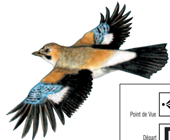
Illustration : Hervé LE GRAËT

Ce circuit de randonnée a été créé à l'initiative de l'association " Les Amis du Pont des Roises ". Le terme " roises " a pour origine le rouissage, opération qui consistait à faire séjourner dans l'eau les plantes textiles pour en extraire ensuite la fibre (le chanvre) et qui était pratiquée dans le ruisseau du village.