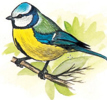
Illustration : Hervé LE GALET