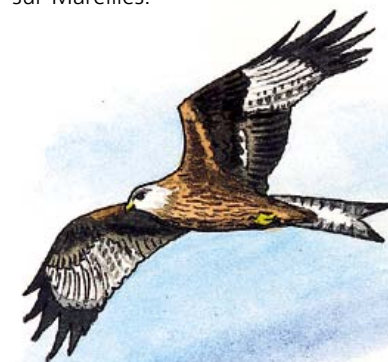
Illustration : Hervé Le Graët

6- Quitter la route et reprendre toujours à droite un chemin caillouteux qui remonte sur Mareilles.