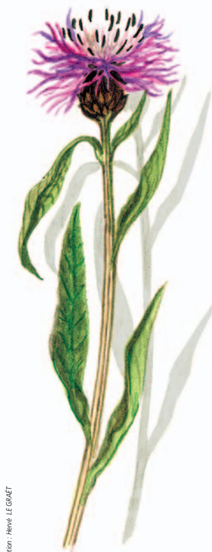
Illustration : Hervé LE COAËT