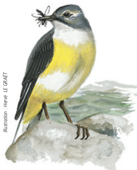
Illustration: Hervé LE GRÈNET