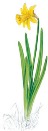
Illustration : Hervé LE GRAËT