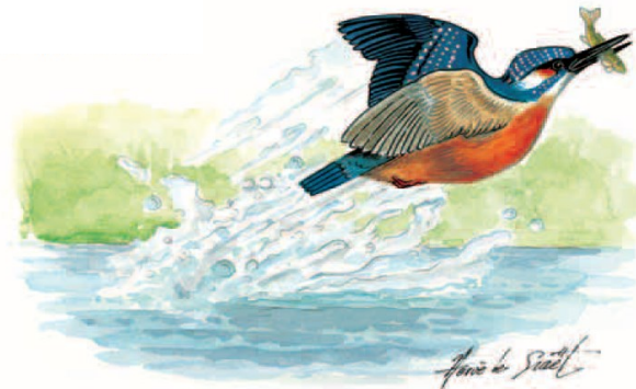
Illustration: Hervé LE GRAPET