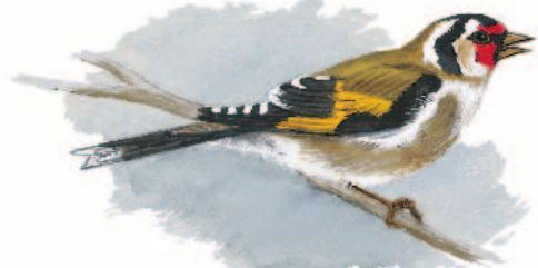
Illustration : Hervé LE GRAPET