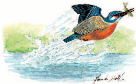
Illustration - Hervé LE GUAËT