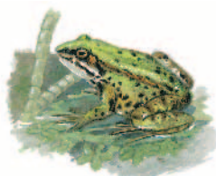
Illustration : Hervé LE GRÂËT

Le chemin traverse le bois et le ruisseau des Vervelles. L'origine du nom "vervelles" n'est pas certaine, il en existe plusieurs versions. C'est avant tout un terme de fauconnerie qui signifiait l'anneau qui permettait d'attacher les armes et écussons du seigneur à qui appartenait le faucon. C'est également un terme nautique nommant les gonds placés dans la quille d'un bateau qui servent à accrocher le gouvernail. Enfin, ce terme nomme également les attaches d'un casque.