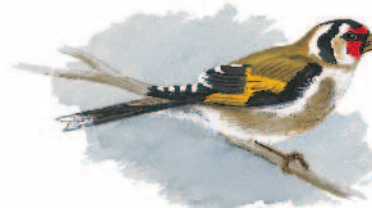
Illustration: Hervé Le Graët

Le tracé de ce sentier historique a été déterminé de façon à respecter au plus près la vraisemblance historique du chemin parcouru par Jeanne d'Arc.