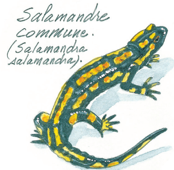
Illustration : Hervé Le Goret

Point de vue Départ du circuit D IGN n° 3116 O (Joinville)