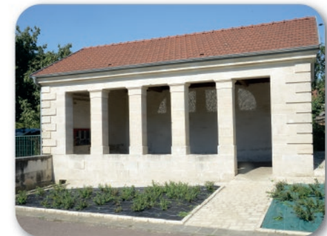
Lavoir - Rochecourt-Suzémont

5- Au carrefour avec la RD2 dirigez-vous vers la droite en traversant Suzémont et retrouvez l'aire de départ de Rachecourt après 500 m en bordure de la route départementale. Circuit ayant une partie commune avec le circuit de la Côte Dardaille au nord et le circuit du chênoi au sud.