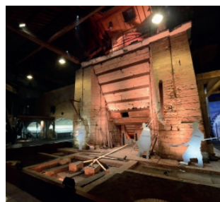
Haut-Fourneau - Metallurgic Park