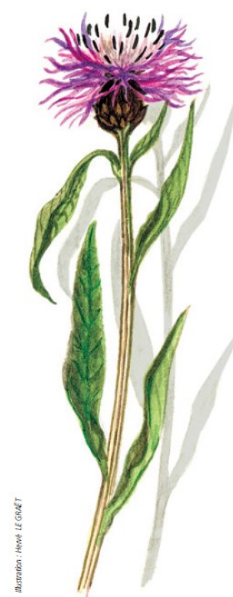
Illustration : Hervé LE GNAET