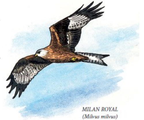
MILAN ROYAL (Milvus milvus)

Depuis le parking de la plage, rendez-vous sur celle-ci, passer la base nautique et tourner à droite pour traverser le lac en empruntant le chemin aménagé qui longe la route. Une fois de l'autre côté, tourner à droite, passer au dessus de l'ancienne ligne de chemin de fer et longer le lac jusqu'aux ouvrages entre le lac et la baie de Champigny.