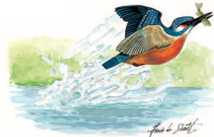
Illustration : Hervé LE GRAËT