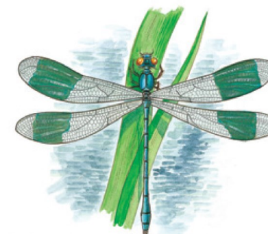
Calopteryx splendens (Harris) (Calopterygidae)

Tourner à gauche en direction de Lecey, puis, à une centaine de mètres, tourner une nouvelle fois à gauche pour emprunter le GR 7. Le suivre jusqu'au bois du Râlet où vous attend un très joli point de vue sur le lac de la Liez et la ville de Langres en point de mire.