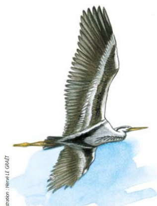
Illustration : Hervé LE GRÂLET