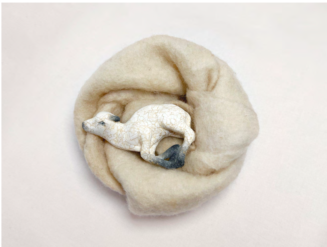
Le Nid / 2026 / Plâtre patiné, maquetterie de coquilles d'oeuf, laine feutrée / 5 x 17,5 x 16,5 cm

Prieuré de Vinetz 4 rue de Vinetz Châlons-en-Champagne (51000)