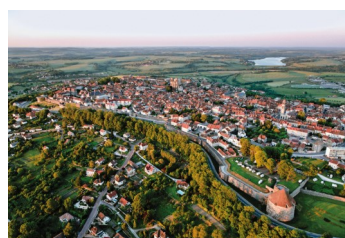
Langres, la cité perchée Ville d'Art et d'Histoire