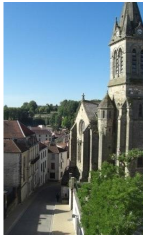
Vue de nos studios - côté rue