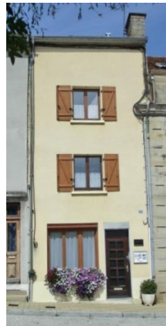
Façade plein sud