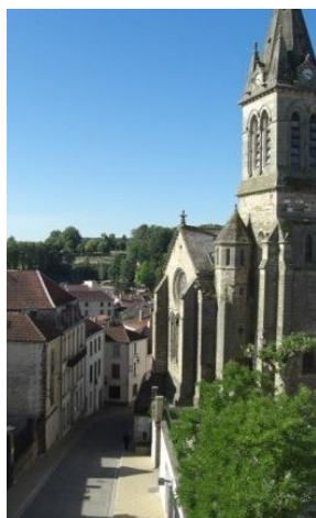
Vue de nos studios - coté rue

Afin de profiter dans les meilleures conditions de votre cure thermale à Bourbonne-les-Bains, nous vous proposons en location un appartement T2 de 55 m 2 au RDC (plain-pied), idéalement situé.