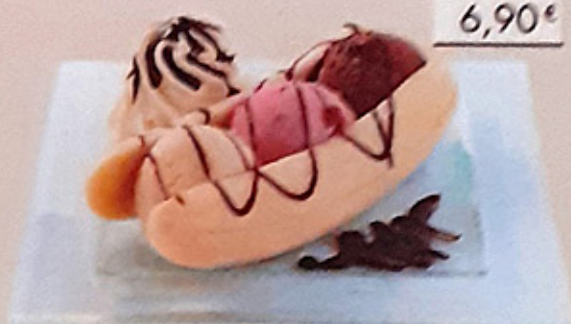
Banana Split banane, Chocolat, Fraise, Vanille, sauce chocolat, crème fouettée banana, Chocolate, Strawberry, Vanilla, chocolate sauce, whipped cream