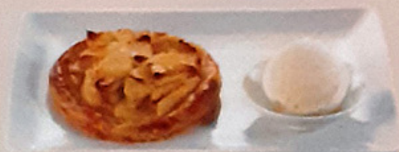
Tarte du moment glace Vanille Vanilla ice cream