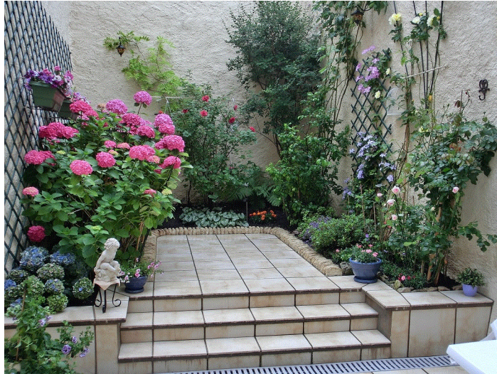
Cour privative RDC