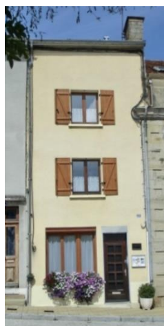
Façade plein sud