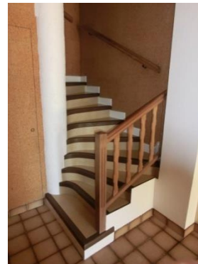
Couloir d'entrée de l'immeuble