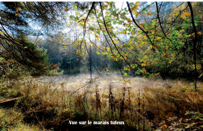
Vue sur le marais tufeux

L'espace "phare" de la Réserve Naturelle est sans nul doute le marais tufeux . Les particularités physiques (géologie, altitude) et climatiques de nombreux vallons du Plateau de Langres ont permis le développement de marais tufeux qui figurent parmi les plus typiques et les plus nombreux de France. Celui de Chalmessin est l'un des plus étendus et des mieux conservés de ce territoire. La richesse écologique est renforcée par la présence sur les pentes et le plateau de divers peuplements forestiers ( hêtraie sèche à Laïche blanche ou froide à Dentaire pennée, chénaie-charmaie ), et d'une pelouse sèche le long de la route de Musseau.