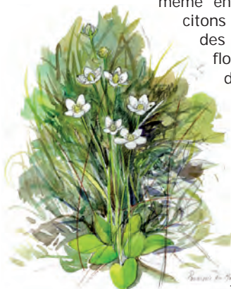
Parnassie des marais

L'originalité principale est la présence d'espèces à caractère montagnard. L'explication est aisée si l'on en croit l'éminent botaniste haut-marnais Paul Fournier. Il écrivait en effet en 1924 dans le bulletin de la Société d'Etude des Sciences Naturelles qu'il gèle dans les combes du plateau de Langres au moins une fois chaque mois, même en juillet et août ! Parmi ces espèces, citons par exemple l'Aconit napel, la Parnassie des marais ou le Choin ferrugineux pour la flore, ou le Cordulégastre bidenté, une des plus grandes libellules de la région. La diversité de milieux naturels et leur qualité accentuent cette richesse.