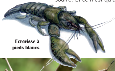
Ecrevisse à pieds blancs