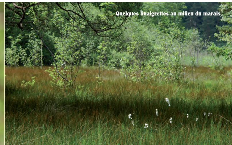
Quelques linaigrettes au milieu du marais