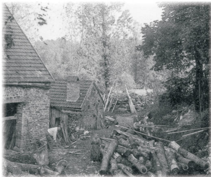
Le moulin du bas

Il fut un temps où ceux qui apportaient eux-mêmes leurs céréales au moulin restaient presque toujours à la mouture ; devant eux, le meunier montait les sacs et les versait dans la trémie de la meule. Pour 100 Kg de blé à moudre, le cultivateur recevait 65 Kg de farine et 20 Kg de son. La différence représentait la valeur du travail du meunier.