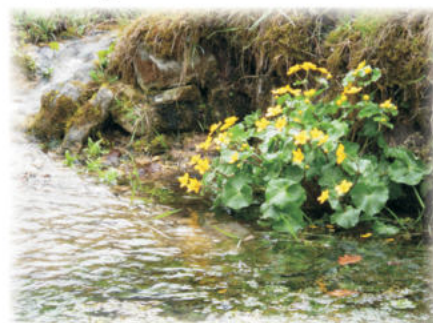
Populage des marais

« Le long des haies où je menais la Rouge et la Blonde, foisonnaient des orties blanches et des stellaires ; après les grappes des acacias et des cytises, les aubépines pointillées de carmin et l'arc fleuri des églantiers ! »