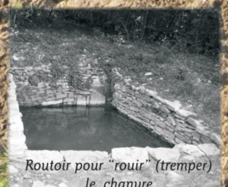
Routoir pour "rouir" (trempier) le chanvre