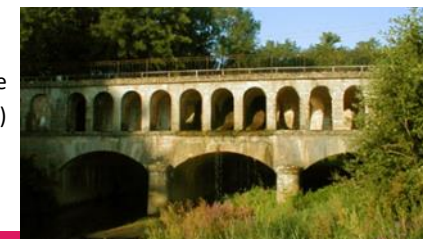
Le pont canal entre Dommarien et Piépape (Direction Villegusien)

Dommarien, un village riche de son passé et confiant dans son avenir.