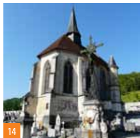
14 Chapelle Sainte-Anne (XVI e s.)