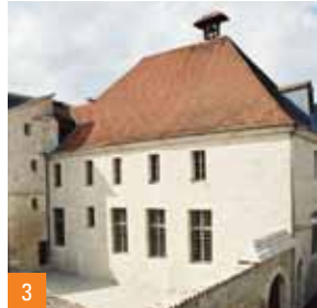
3 Auditoire (XVI e s.)