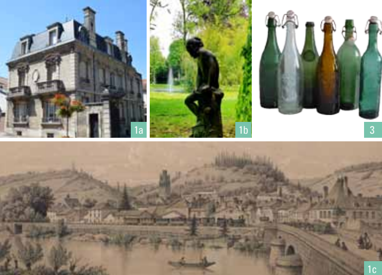
1a. Maison de maître de forge de la rue Aristide Briand / 1b. Une fonte d'art locale dans le parc du Château du Grand Jardin / 1c. Vue de Joinville au début au XIX e siècle / 3. Bouteilles de l'ancienne brasserie de Joinville