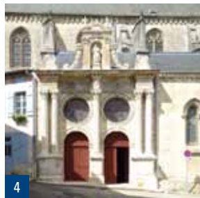
4 Portail Renaissance de l'église Notre-Dame (XVI e s.)