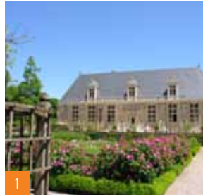
1 Château du Grand Jardin (XVI e s.)