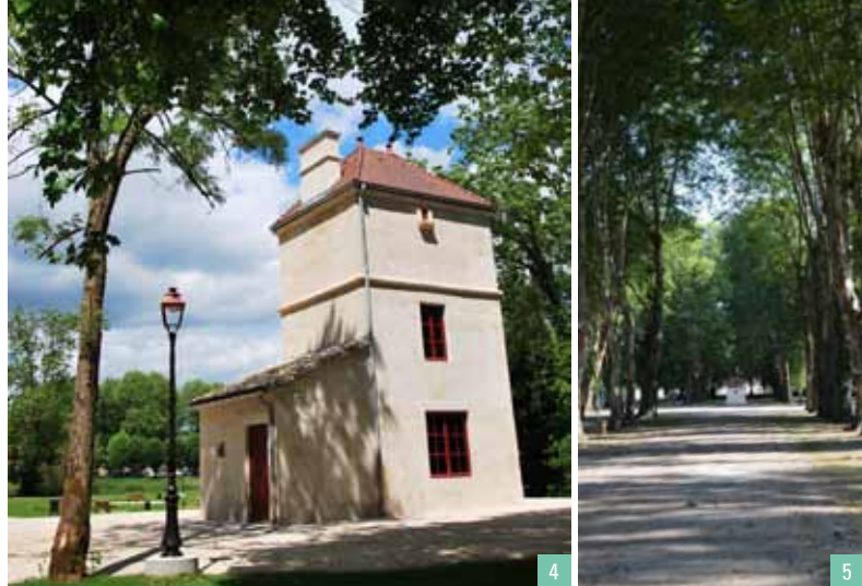
4. Pigeonnier du Cavé, ancienne fabrique de jardin / 5. Parc du Petit-Bois et ses fontes d'art

Corrolaire au développement de l'industrie, se développe un habitat ouvrier typique se développe, encore visible