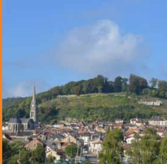
Vue de Joinville et du site de l'ancien Château d'En-Haut (détruit à la fin du XVIII e s.)

La Renaissance est pour Joinville une nouvelle période de faste : choisie comme capitale par Claude de Lorraine, premier duc de Guise, et son épouse Antoinette de Bourbon, la ville bénéficie de leur mécénat. Les Guises façonnent alors la ville à leur image. Claude fait moderniser le château féodal, installé sur la butte qui surplombe la ville, dans le style Renaissance qu'il a découvert lors des guerres d'Italie où il accompagne François I er . Il fait ensuite construire un pavillon de fête (actuel château du Grand Jardin) dans le même style, qu'il entoure d'un vaste jardin vanté par Remy Belleau, auteur de la Pléiade, dans sa Bergerie . A sa mort, son épouse poursuit son œuvre : elle commande avec son fils aîné, François, second