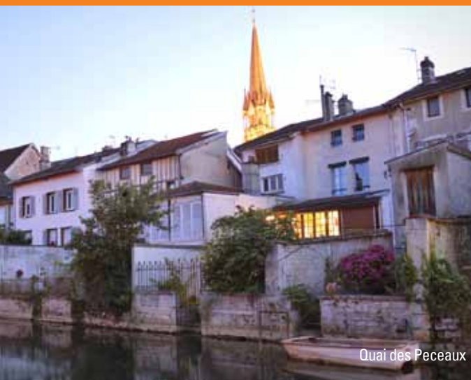
Quai des Peceaux

Le territoire du nord de la Haute-Marne connaît un renouveau au XIX e siècle, grâce au développement de la fonderie d'art, dont plusieurs usines sont installées sur la commune et aux alentours. Usines, maisons de maître de forge, habitat ouvrier fleurissent, complétant le patrimoine de la cité.