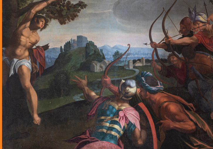
Détail du tableau datant de la fin XVI e siècle, présent dans l'église de la cité, représentant un saint Sébastien devant la butte de Montsaugeon dans un paysage idéalisé.

Montsaugeon est ensuite progressivement cédée à l'Evêché mais garde de sa puissance.