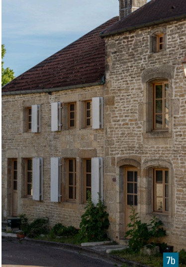
7a et 7b. Maisons typiques de Montsaugéon