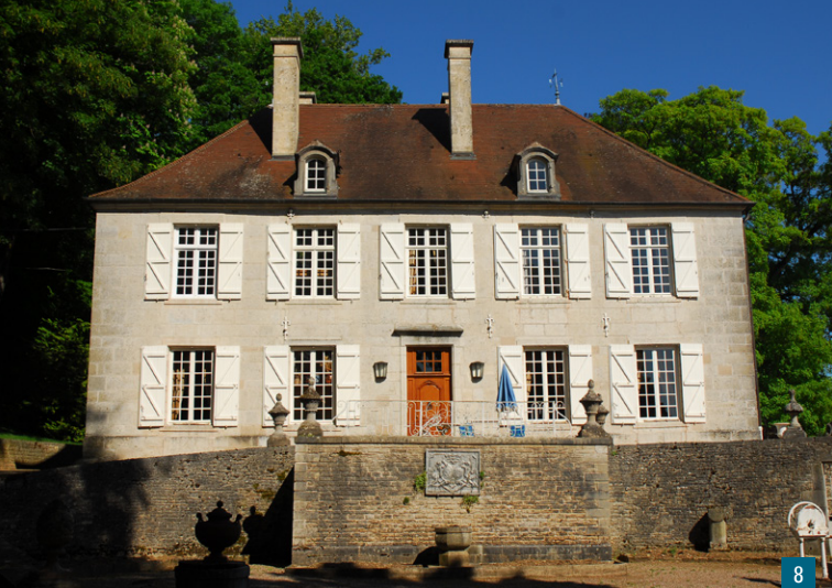
8. Façade arrière de l'ancien château épiscopal