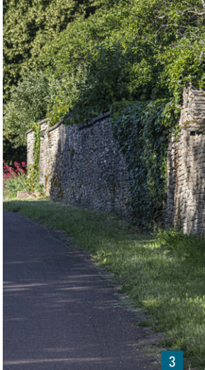
2. La porterie médiévale de Montsaigeon / 3. La promenade des remparts

une bretèche (disparue) et une bouche à feu encore visible. Le passage piétonnier, à gauche, a été réaménagé tardivement pour servir de prison et son couronnement a été refait en 1857 par l'architecte langrois Henri Brocard.