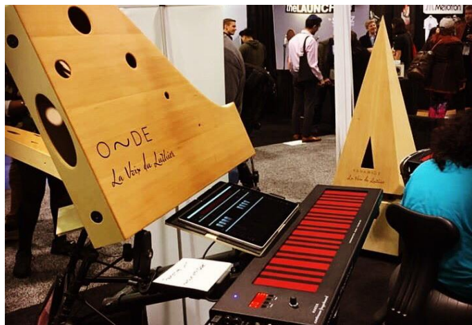
prise au NAMM en 2020 en Californie

JOURNÉES EUROPÉENNES DU PATRIMOINE SAMEDI 16 ET DIMANCHE 17 SEPTEMBRE